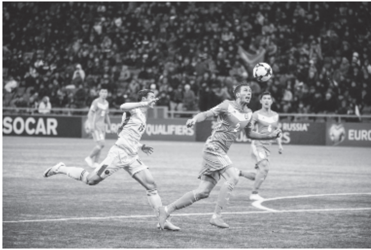
A román játékosoknak nem sikerült alkalmazkodniuk az asztanai műfüves pályához.

A mérkőzés első helyzetét Stancu hagyta ki (a 9. percben), majd a házigazdák kerültek jó helyzetbe, de Hizsnicsenko hibázott, ezt köve-